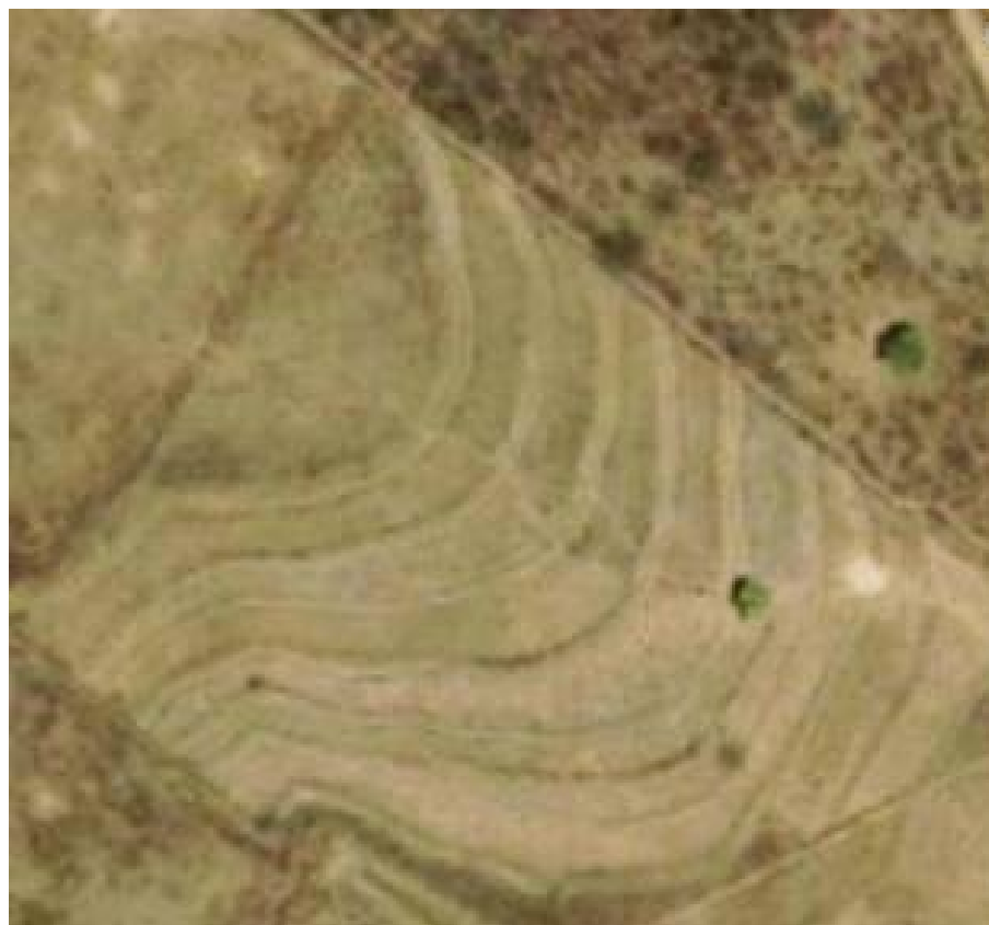
Figura 4.2. Visão aérea dos cordões de pedra em contorno