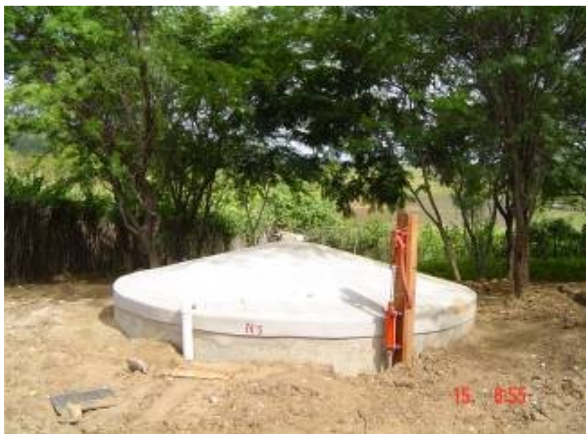
Figura 4.4. Cisterna de placa construída pelo projeto

No semi-árido a chuva se concentra no início do ano e escorre para os leitos dos rios, que vão para o mar. Em solos mais profundos ela é rapidamente absorvida, só tendo acesso com a cavação de poço. Nos outros meses do ano, os brasileiros que moram no semi-árido sofrem com a seca. Uma solução para evitar o desperdício de um bem tão precioso como a água é a construção de cisternas, que fica próximo do consumo. Esses equipamentos são feitos com placas de cimento pré-moldadas, capazes de guardar, de seis a oito meses, toda a água da chuva que cai dos telhados. “São como cofres, que guardam a água poupada”.