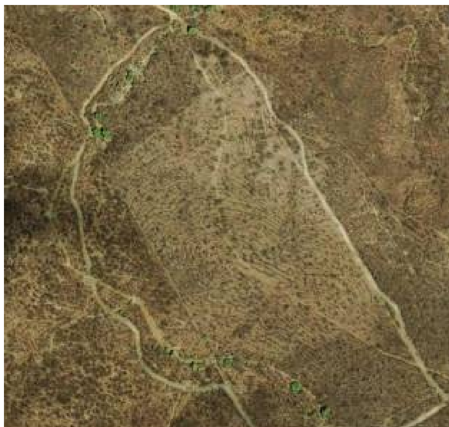
Figura 4.3. Visão aérea a área de agrosilvipastoril no contorno da cerca em branco

Pode-se procurar ainda apoio de Órgãos Não Governamentais(ONG's) na disseminação dessa técnica, bem com apoio na colocação dos produtos gerados por essa atividade com selo orgânico.