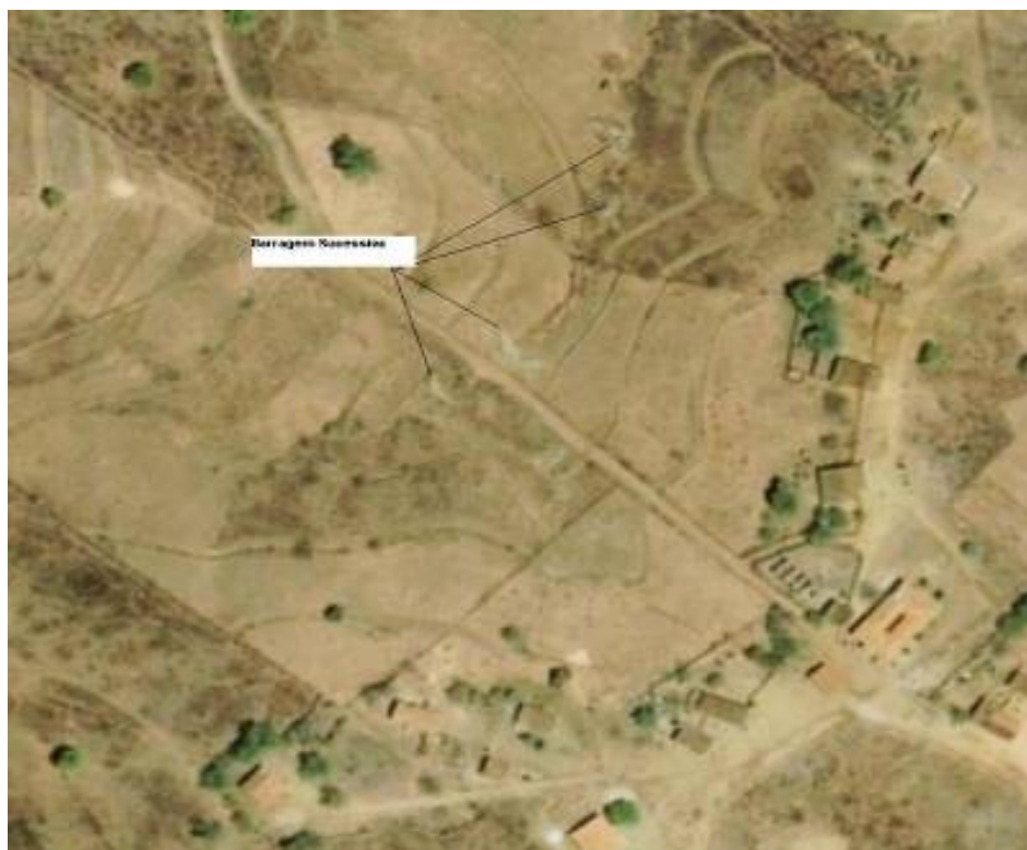
Figura 4.1. Visão aérea das barragens sucessivas

Os solos do semi-árido são geralmente, suave ondulados e ondulados, facilitando enormemente ao desprendimento de sedimentos pelas enxurradas, que se não forem impedidos vão se depositar nos açudes ou na calha dos rios, assoreando-os e criando problema cheias quando uma nova chuva intensa chegar.