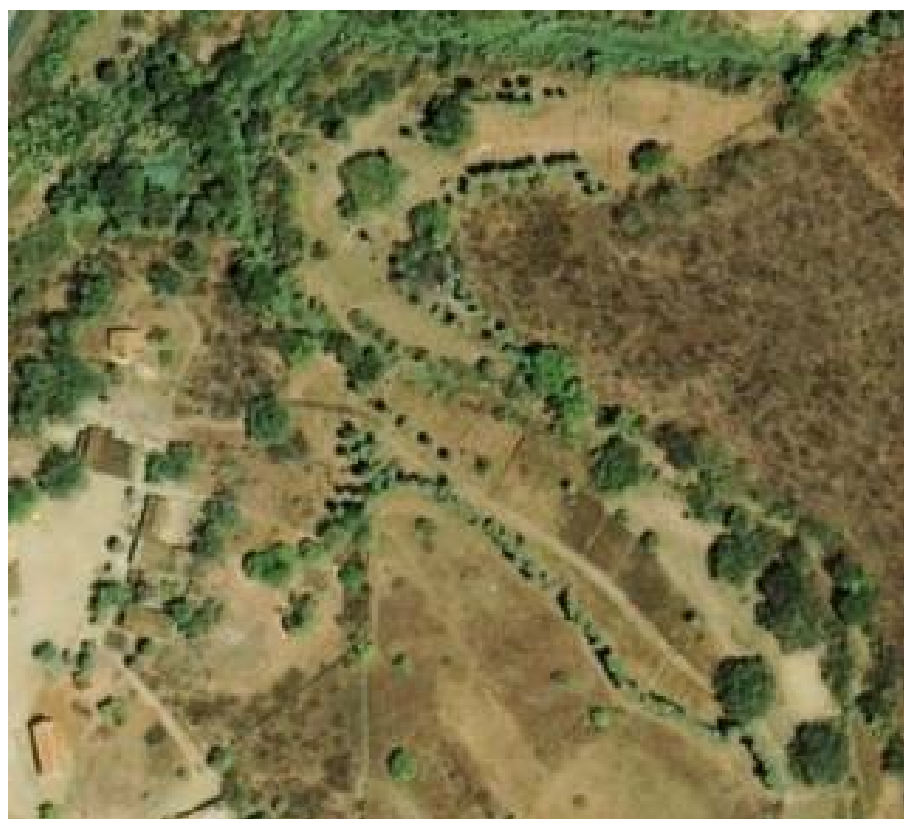
Figura 4.3. Visão aérea a mata ciliar plantada

Todos os rios do semi-árido cearense encontram-se com áreas de matas ciliares devastadas, sendo, portanto, altamente recomendável a adoção do replantio das margens desses rios, como forma de impedir as perdas de solo aluvional nos períodos de cheia. Era importante que as próprias prefeituras assumissem esse objetivo, criando hortos florestais em diversas comunidades espalhadas pelos município e fornecessem mudas para a população replantar as área desmatadas.