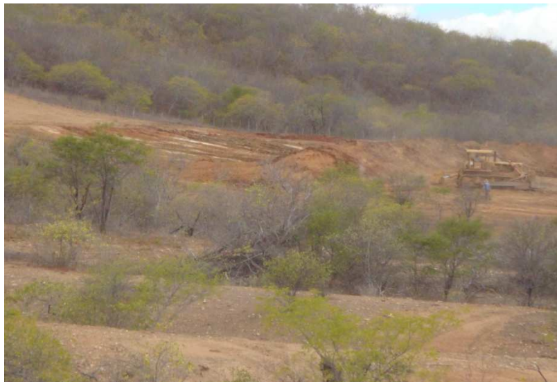
Foto 4.2: Trator de Esteira com Lâmina na execução da Limpeza da Área para início do Serviço

O procedimento executivo constitui-se, basicamente, na operação do trator com lâmina rebaixada até a profundidade necessária para arrancar inclusive as raízes. As árvores de maior porte serão cortadas manualmente com uso de moto-serra.